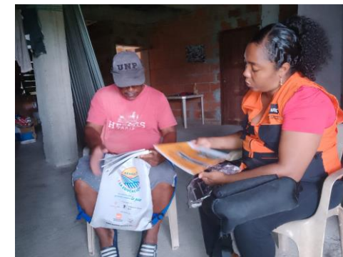
Entrega de Kits escolares a 15 estudiantes