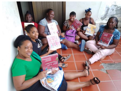
Entrega de módulos Modelo Etnoeducativo

Modelo Educativo Flexible “Modelo Etnoeducativo para comunidades negras del Pacífico Colombiano”.