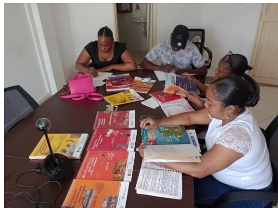
Formación docente y entrega de kits.